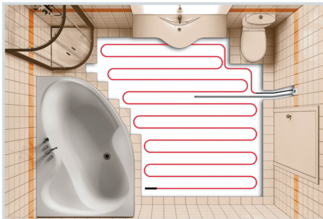
Схема укладки кабеля на свободную площадь