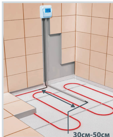
Схема укладки датчика температуры в гофрированной трубке